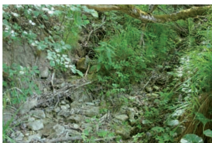
Lineare Quelle Gerstelbach, Waldenburg