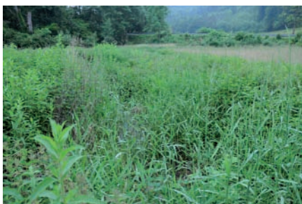
Alluvial-Fliessquelle Orisbach, Lupsingen

Aufgrund der Erfahrungen aus den bisherigen Untersuchungen ist im Kanton Basel-Landschaft mit bis zu 600 grösseren naturnahen Quellen zu rechnen. Bei einer Berücksichtigung kleinerer Quellaustritte dürfte sich die Zahl auf über 800 erhöhen.