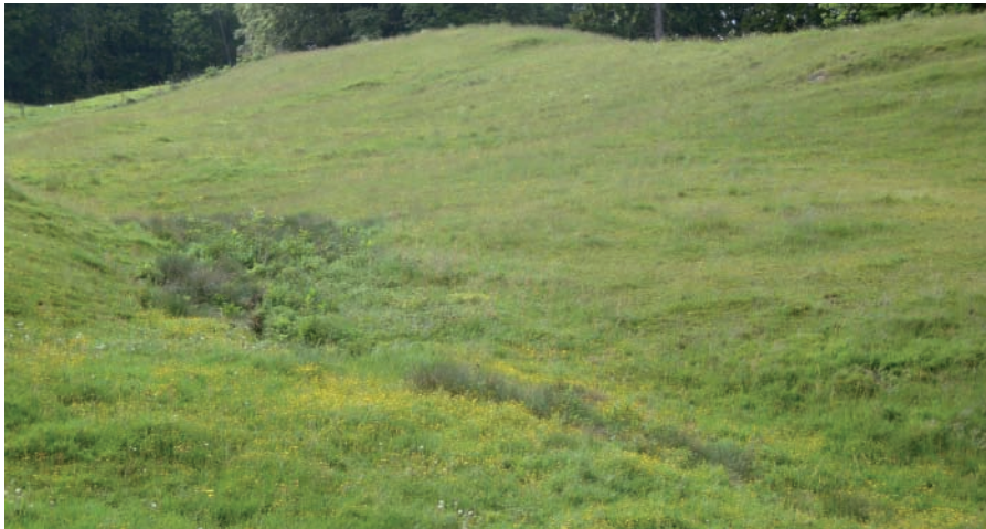
Quelle Oberer Dürrenbergbach in Langenbruck. Die Lebensgemeinschaft in dieser Offenlandquelle besteht aus besonders vielen typischen Quelltieren

In allen Gemeinden sollen die Quellen im Rahmen der kommunalen Landschaftsplanung erfasst und geschützt werden. Bei intakten Quellen lohnt sich auch eine genaue Bestandenserhebung der Lebensgemeinschaft, mit welcher der Schutzbedarf abgeklärt und begründet werden kann.