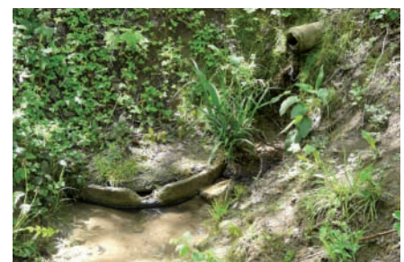
Künstlicher Austritt Chäppelbach, Therwil