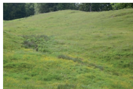
Sickerquelle Dürrenbergbach, Langenbruck