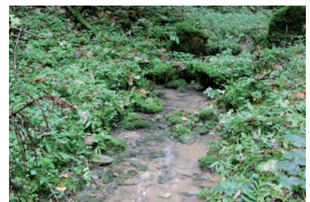
Karst-Fliessquelle Chrintelbach, Rünenberg