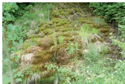
Kalksinter-Fliessquelle Rösersbach, Liestal